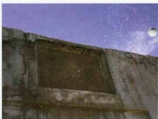
کتیبه سردرب ضلع شمالی