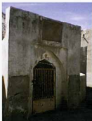
دهانه و کتیبه ضلع شمالی