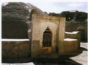
دهانه برداشت لب شمال شرقی