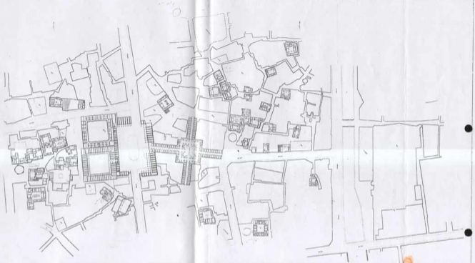
شهر قدوم کار در حفاظت و بازنشانی وضع موجود |