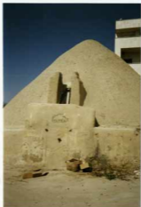
تویح کبر، خانه آستان قدس