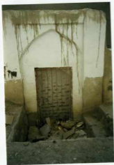
تویح کبر، خانه آستان قدس