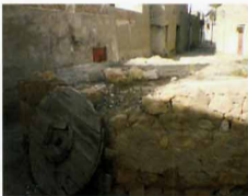
نمای شمالی آب انبار باغچه شیخ