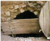
آب انبار باغچه شیخ