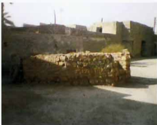
نمای شمال غربی