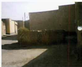
نمای جنوبی بنا