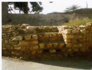
نمای غربی بنا