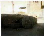
نمای آب انبار باغچه شیخ