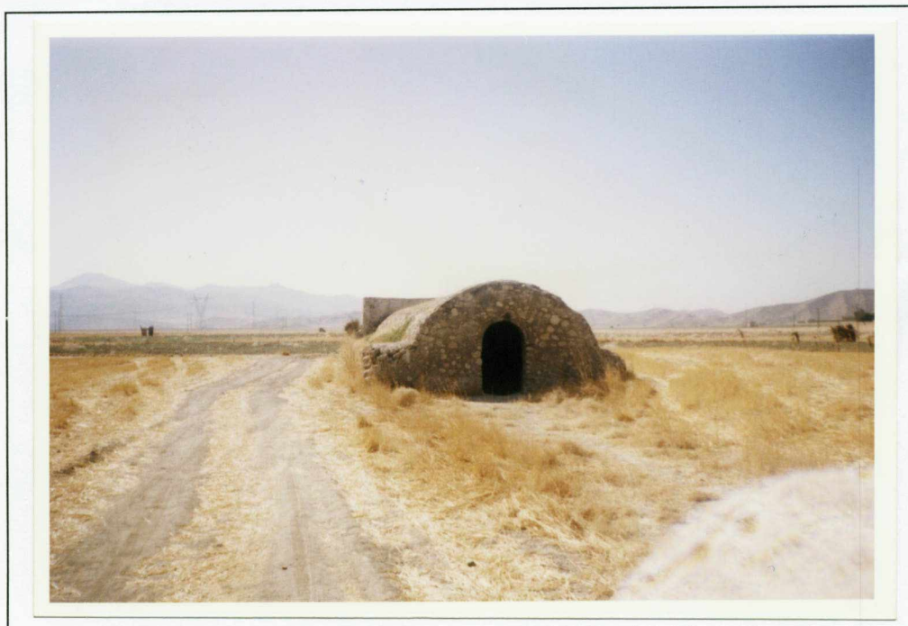
تصویر ۴- نمای کلی بنای آب انبار ده کهنه کمارج. دید از غرب؛ ف...۱...ن...۳...۱-.....