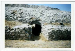
تصویر ۶- نمای در بنای آب انبار ده کهنه دید از جنوب: الف. ۱-ن. ۵-۱