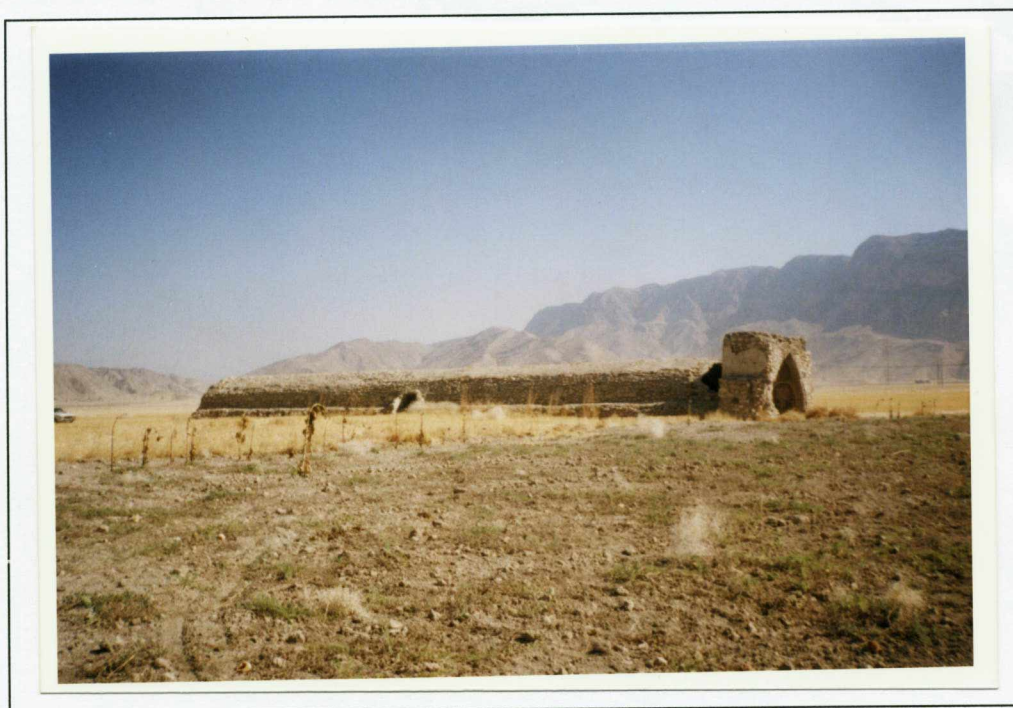
تصویر ۳- نمای کلی بنای آب انبار ده کهنه کمارج دید از شمال؛ ف...۱...ن...۲...۱-.....