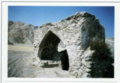
تصویر ۵- نمای ورودی بنای آب انبار ده کهنه دید از جنوب: الف. ۱-ن. ۲-۱