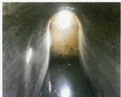
مخزن و سقف آب انبار