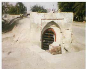
دهانه شمالی آب انبار