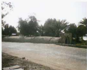
نمای غربی آب انبار دراز کوریجان