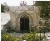
دهانه جنوبی آب انبار