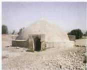
دهانه شمالی بیرگپ