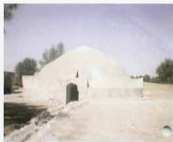
کاتال ابرسا نی به برکه شماره ۲ پدز