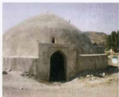
دهانه جنوبی آب انبار ۲ بیرگپ