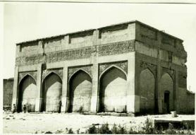
منیره معروف بد خترانایک "آبش خاتون"