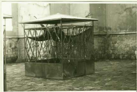
منیره معروف بد خترانایک (آبش خاتون)