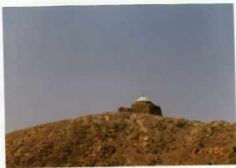
آرامگاه عواجیه هکاشته، دید از شرقی