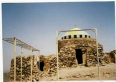
آرامگاه عواجیه هکاشته، دید از جنوب