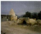
دورنمای بقعه و آب انبار درویشان