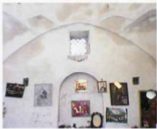
طاقنمای داخلی بقعه