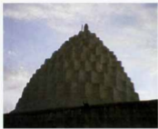
گتبد مضرس بقعه