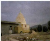
نمای جنوبی بقعه درویش عالی