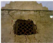
پنجره مشیک چوبی