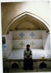
سربینه شرقیه حمام