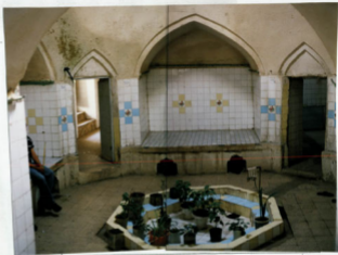
شرح مکتب: موقوف و سربینه حمام