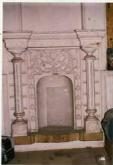
توضیح عکس و اولویت آن نمای گچبری در اتاق ضلع غربی