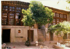
نمایش عکس و درونیت آن قسمی از حیاط و نمای غربی