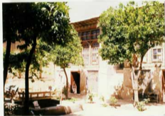
نمایش عکس و درونیت آن قسمی از حیاط و نمای شرقی