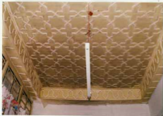
توضیح عکس و اولویت آن سقف اتاق ضلع شرقی