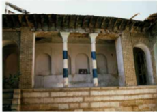
شماره عکس: ایران ضلع جنوبی