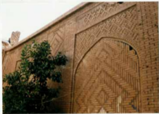
شماره عکس: بدنه آجرکاری ضلع شرقی