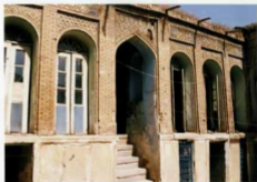
شماره عکس: نمای بر روی صلیب غربی