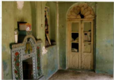
شماره عکس: فضای داخلی اتاق صلیب غربی