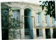
شماره عکس: نمای سردی صنایع معدنی