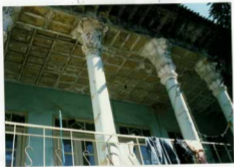
شماره عکس: جزئیات کتیبه‌های سردی در سرسبزهای ایوان