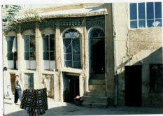
شماره عکس: نمای دروازه صلح سازی