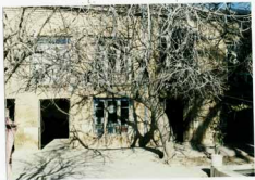
شماره عکس: نمای سردی صلح سازی