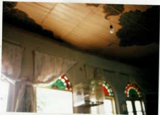
شرح عکس: فضای داخلی اتاق صلح غربی