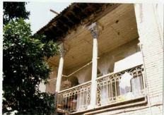
شرح عکس: نمای بیرونی ایوان مسجد اربعه غربی