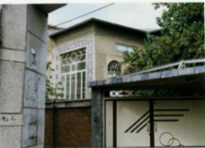
شماره عکس: نمای ورودی و قسمتی از نمای بنا