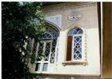
عکس، جزئیات تزئینات در نمای بنا