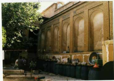
شماره عکس: اتاق‌های ضلع شرقی و قسمتی از حیاط