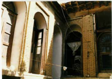
شماره عکس: قسمتی از ضلع غربی و شمالی بنا