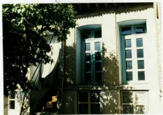
شرح عکس: نمای بیرونی ضلع شمال غربی