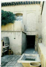
شرح عکس: قسمتی از حیاط، باریدارالحاقی و ورودی