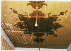
توضیح عکس و برداشت آن سقف بنجرری شاهی