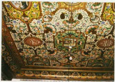
توضیح عکس و برداشت آن سقف تالار آینه کاری