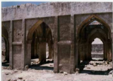
توضیح عکس و بزرگنمایی آن نمای غربی شبستان مسجد