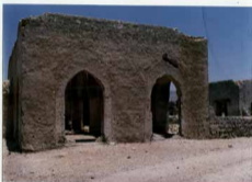
توضیح عکس و بزرگنمایی آن نمای شرقی مسجد