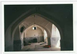
تصویر 2- شبستان مسجد حاج طالب. دید از شرق؛ ف 15 ن 8