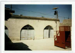
تصویر 1- نمای کلی بنای مسجد حاج طالب دید از شرق؛ ف 15 ن 6