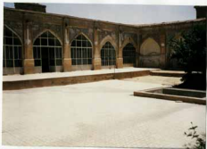
شرح عکس: فضای سنگلوی شمالی و نزوی