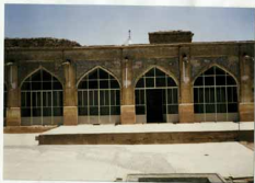
شرح عکس: حیضوم شمالی