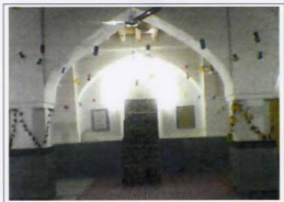
شیستان مسجد حاجی صادقی در لار