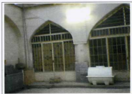
شبع شرقی مسجد حاجی صادقی