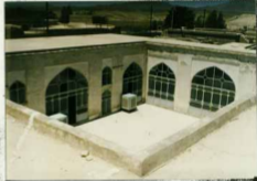
توضیح عکس و موقعیت آن