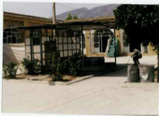
ساخت و ساز اقامت مرفوعہ در وسط محض اہل مسجد