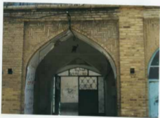
منع حنبلہ مسجد