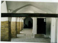
منع سرتہ مسجد