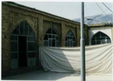
ضلع سترتہ مسجد