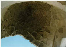
شرح عکس: تاقی نزدیک پوشش گنبدی مسجد