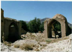
شرح عکس، قسمتی از دیوار و مسجدستان گنبد دار