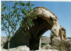
شرح عکس، نمای جنوبی گنبد مسجد