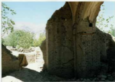
شرح عکس: قسمتی از سبستان و محراب مسجد