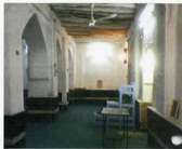
سقف تیر پوش شبستان