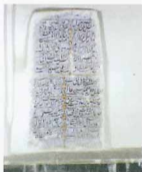
کتابچه موجود در بنا