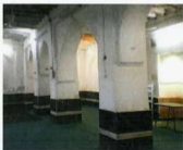
شبستان مسجد نو