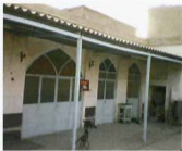
حیاط مسجد نو