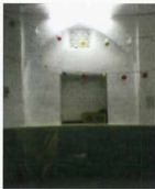
طاق نماهای داخل مسجد