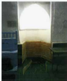
محراب در ضلع جنوبی