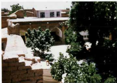
ناخالز جبهه حنظل سعید