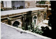
جبهه غربی سعید