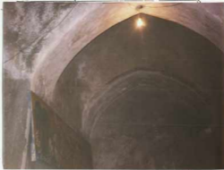
توضیح عکس و بودجهت آن: تکسهای سیتام جام