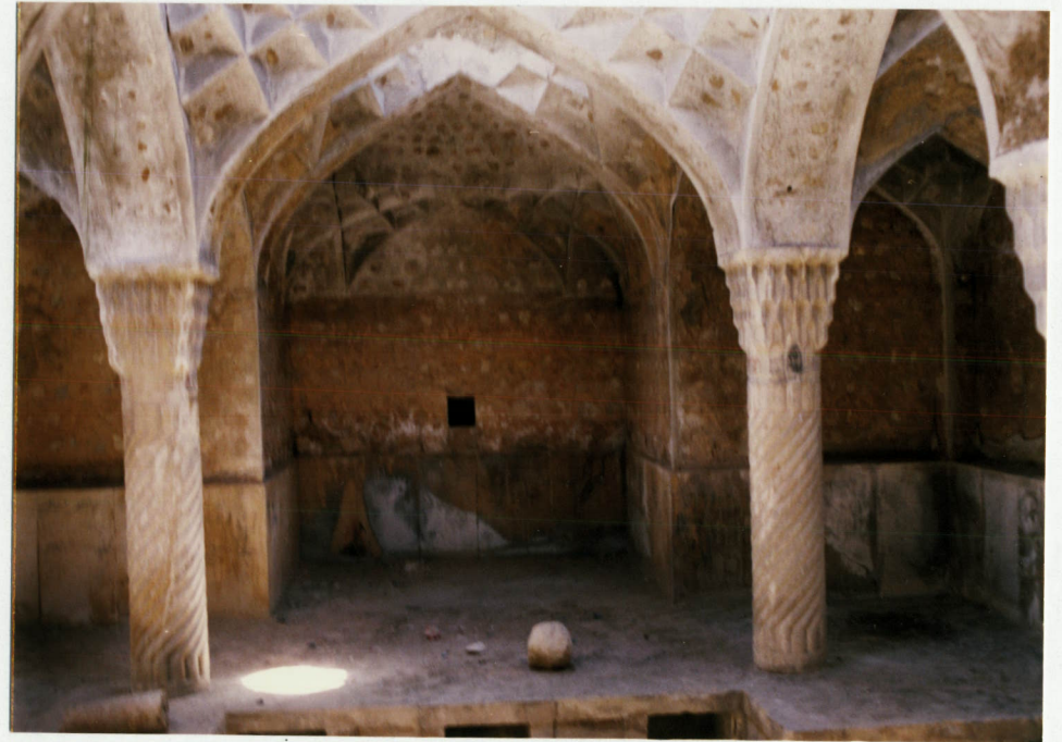
توضیح عکس وموقعیت آن - نمای داخلی حمام شیخ علیخان - سرینیه