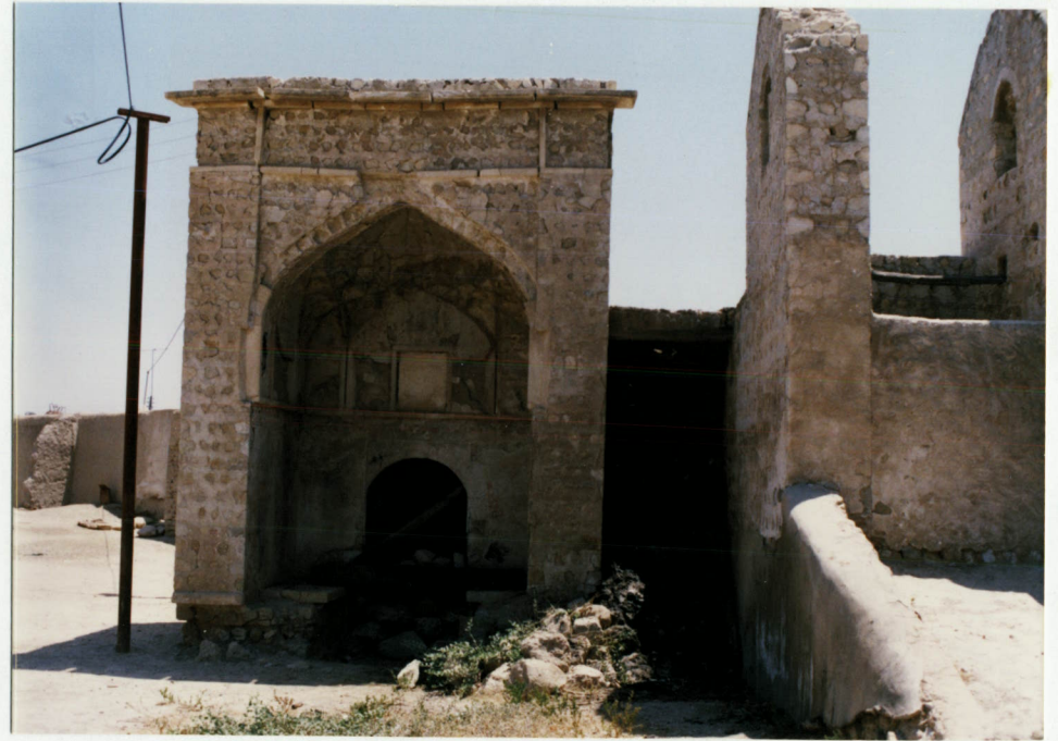
توضیح عکس وموقعیت آن استای بیست بام حمام شیخ علیخان