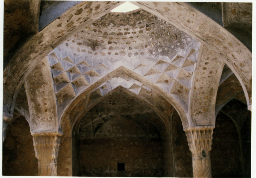
توضیح عکس وموقعیت آن نمای داخلی منیا - گرمخانه و خزانه