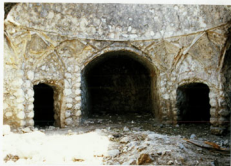
حمام نهبلیان - ایوان و اتاقهای مجاور