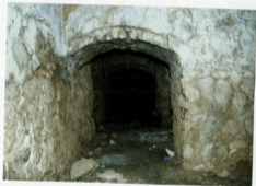
حمام مهلبان - رلهو و میهت انامها و ایلان حنبری