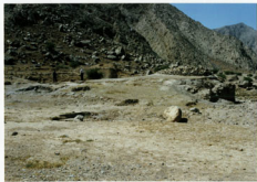
حمام فہلیان - شاوی کلی - مشرق