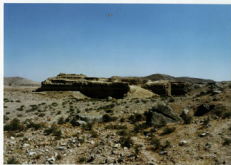
حمام فہلیان - شاوی کلی - مغرب