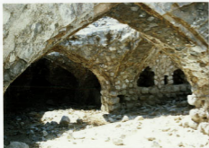
حصار فہلیان - سالی داہلی گرومخانہ