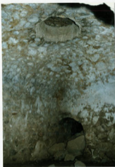
حمام مهلبان - نقره دستری، بعضی از مضامین