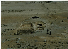
حمام فہلیان - ضای کلی از جنوب