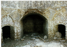
حمام نهبلیان - ایوان و فضاهای مجاور - ضلع جنوبی