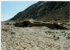
حمام فہلیان - ضای کلی - شمال مغربی