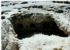
حصار فہلیان - سالی معوجی - گرومخانہ