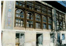
شرح عکس: نمای شمالی وزیر برز میهنیا