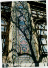
شرح عکس: جزئیات کاشی کار و طبع شمالی