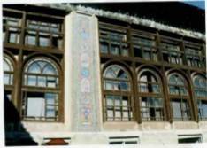
شرح عکس: نمای بیرونی تالار شمالی