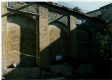
شرح عکس: بدنه شرقی حیاط