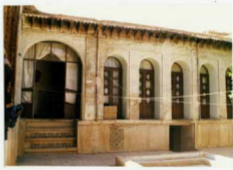
توضیح نگس و سورهت آن صنعه غربی