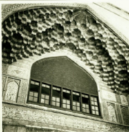
سردر مدرسه خان شیراز