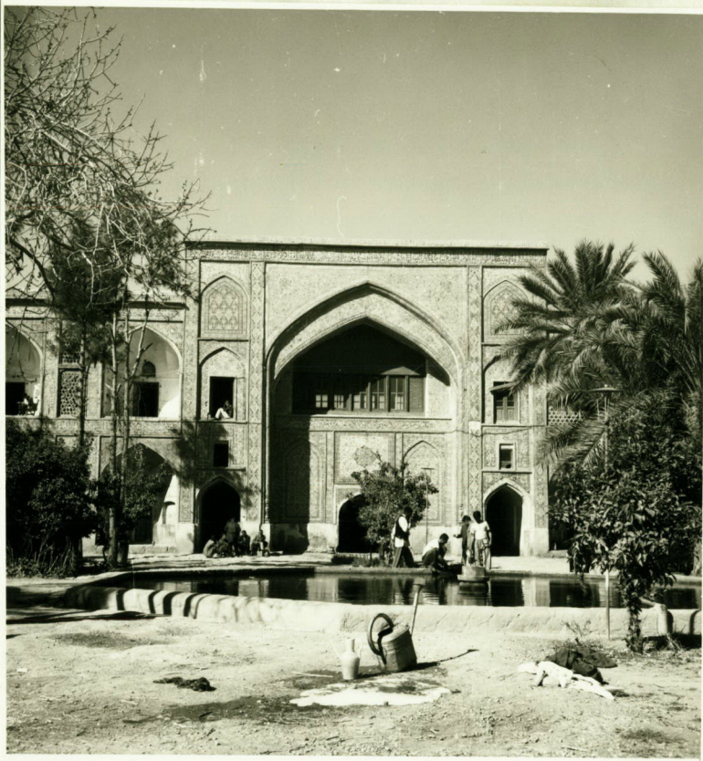
نمای داخلی سردر مدرسه خان