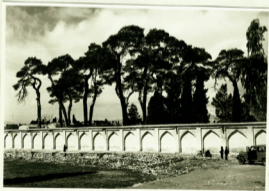
پل هفت تنان