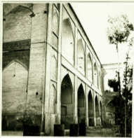
مدرسه خان شیراز