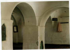
نمای داخلی مسجدستان، خنجر و تاق ها و دو کتیبه کدوره خنجره که تراشیده شده.