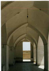
سرواق پیش و دومی و تاق های تنگ و دار