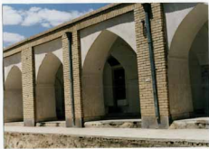
دو نما از چینه بیرون سای مسجد