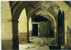
شرح عکس: شبستان محراب درونی از الحاقات جدید