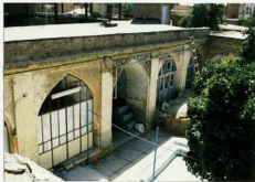
شرح عکس: نمای از سطح حیاط