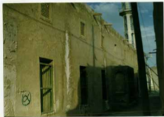
مسجد جامع اوز - نمای غربی قبل از آبرکاری