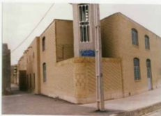
مسجد جامع اوز - زاویه جنوب غربی، مناره، ناسازی جدید